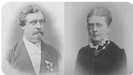
Mårtens mormors farfars föräldrar i Värmland.

Vid temadagen "Fynd på GF:s hyllor" 2024-10-12 hölls tre föredrag: