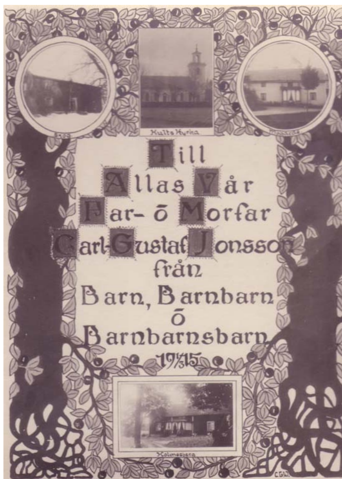
Figur 2 Titelsidan