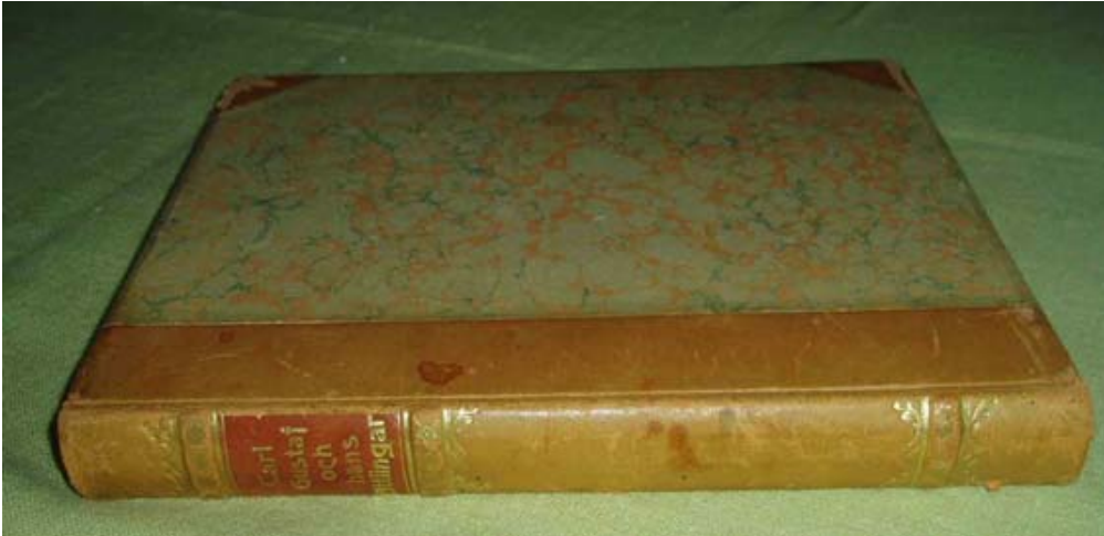
Figur 1 Släktboken.

verkar ha etablerats som släktnamn. Det ena, Wictorin, bland flera av Carl Gustafs barn och barnbarn och det andra, Werner, bland fyra av hans barnbarn (alla syskon). Namnet Landegren antas dessutom av äldste sonen. De övriga släktnamnen i undertiteln till artikeln, Lindgren och Cederblad, bärs i barnbarnsgenerationen.